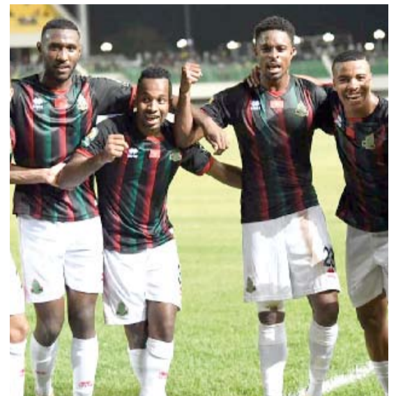
فرحة لاعبي الجيش الملكي بالتأهل لدور الربع