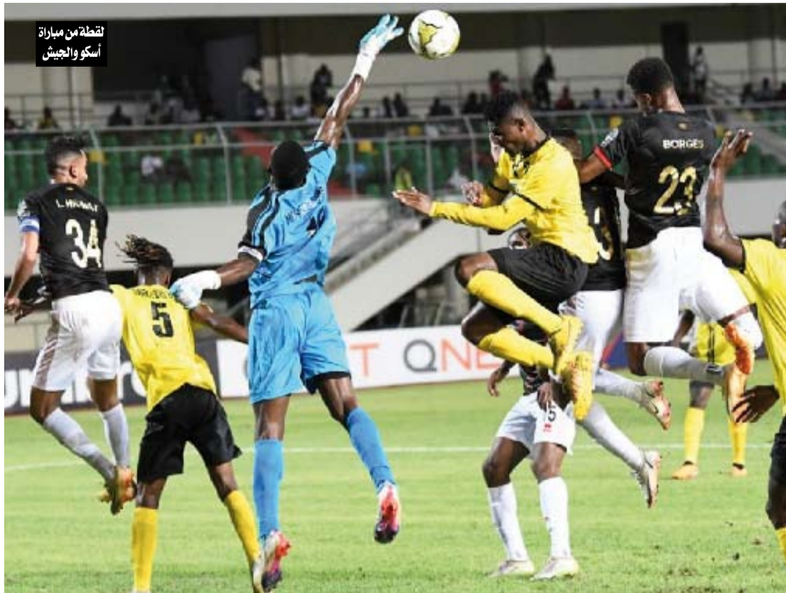
لقطة من مباراة أسكو والجيش